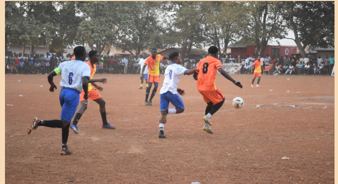
Asedaye Keep Fit Club (in orange) in action.

Es war schön, wieder da zu sein. Ich habe einige der Kinder wiedergetroffen, die vor 10 Jahren, als ich Freiwillige war, noch die „Kleinen“ waren. Jetzt sind sie erwachsen, haben die Schule abgeschlossen und gehen zur Uni oder arbeiten. Ich konnte auch neue Patenkinder von Asedaye kennenlernen, von denen ich bisher nur gelesen hatte. Jetzt kenne ich ihren Charakter, ihr Lachen und weiß auch ein wenig über ihre Persönlichkeiten. Generell war ich beeindruckt von der Gruppendynamik: Die älteren helfen den jüngeren, kümmern sich umeinander und haben Spaß an gemeinsamen Spielen wie Uno und Skip Bo, die immer noch zu den beliebtesten Spielen gehören. Es gibt Freundschaften, die durch Asedaye