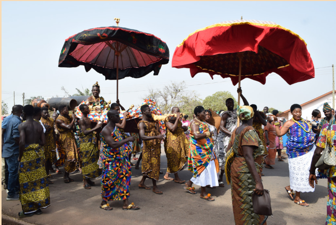
Umzug der Chiefs. The parade of the chiefs.

nicht trug, musste nach Hause gehen, sonst gab es Ärger mit den Wachen. Der Höhepunkt des Festes war der Umzug der Chiefs und die große Feier im Stadion von Dormaa.