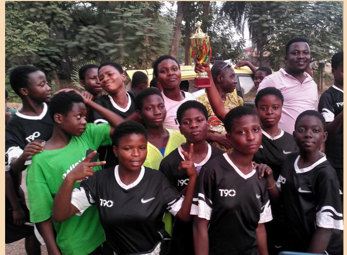
Das Gewinnerteam feiert ihren Sieg! Celebration of the winning team!

The funfest was held on Tuesday the 16th & Wednesday the 17th of December, 2024 at the Presby Park in the center of Dormaa Ahenkro.