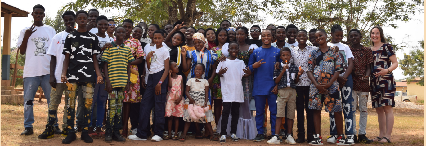
Gruppenfoto Weihnachtsfeier. - Group picture christmas party.

in Situationen, in denen es um viel geht, kritisch zu denken. Vor allem aber habe ich mit meinen Mannschaftskamerad*innen lebenslange Freundschaften und Erinnerungen geschaffen. Diese Erfahrung war ein Beweis dafür, was man erreichen kann, wenn Einzelne mit einem gemeinsamen Ziel zusammenkommen. Ich bin dankbar für die Gelegenheit, daran teilgenommen zu haben, und freue mich darauf, das Gelernte in der Zukunft anzuwenden.