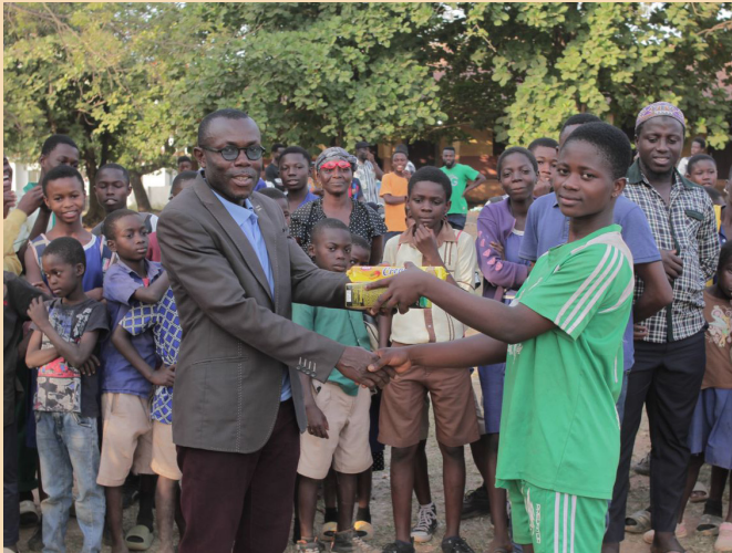
Übergabe der Preise. Presentation ceremony.

das bei weitem das bessere Team war. Ihr Preis waren neue Trikots für ihre Mannschaft sowie ein Pokal.