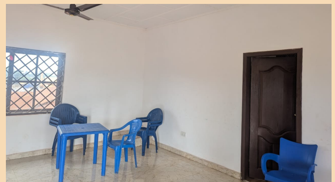
Gemeinschaftszimmer - meeting room