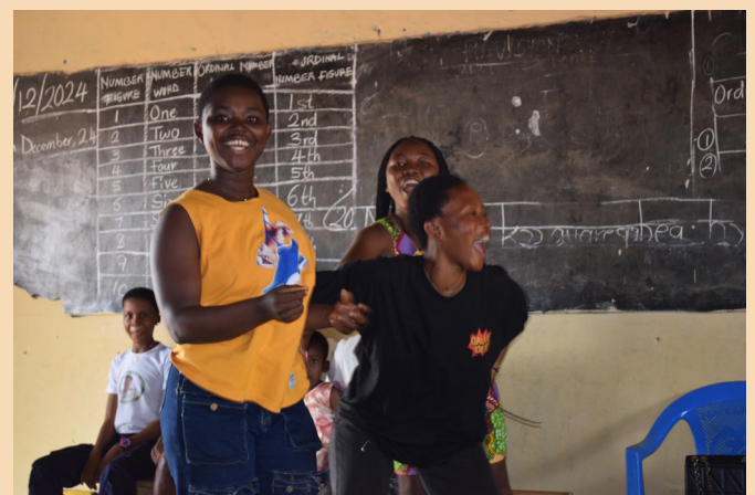
Die Mädchen freuen sich über den Sieg im Sprichwort-Wettbewerb.

We continued the second part at the Aseda Ye premises. Here is where we enjoyed ourselves the most. When we reached there, we settled down and the Aseda Ye chefs served us with some soft drinks and chicken which was so tasty to refresh ourselves. As we always say that sharing is caring, therefore, Aseda Ye gave us 5kg of rice, a crate of eggs and a full chicken to enjoy with our families. We were so excited because upon all what they did for us, they also remembered our families so we and our families really appreciated it.