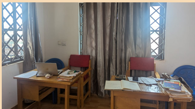
Büro - office