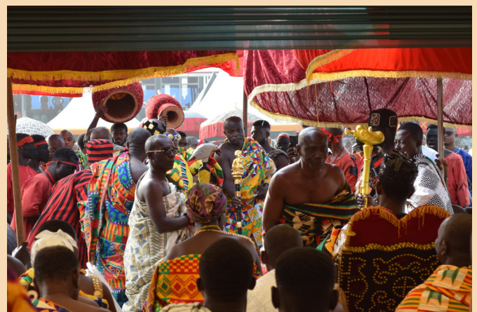
Großes Gedränge auf dem Festivalgelände. Big crowds on the festival site.