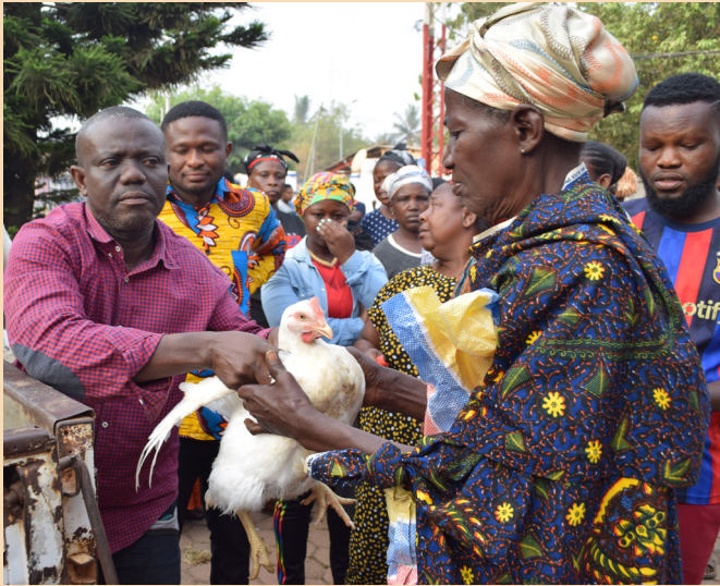
Übergabe eines Weihnachtshuhns. Handing over a christmas chicken.

ganized again in 2024 in cooperation with Gifts FM radio station. 150 women and men received a chicken for them and their families. And in the very end I supported the Aseda Ye keep fit club football team, who took part in the annual Aponkye (Goat) Cup.